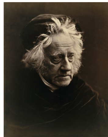
John Herschel, portrait par la célèbre photographe Julia Margaret Cameron

Changeons de perspective et penchons-nous sur la réaction générale de Herschel à la théorie de Darwin. Pour Herschel, il y a deux modes de fonctionnement possibles des changements dans le monde naturel, soit ils sont dirigés par une entité divine soit ils fonctionnent selon les lois de la nature, qui génèrent ses « causes véritables ». La sélection naturelle pourrait , à son avis, être une cause véritable. Mais pour avancer cet argument, il nous faudrait démontrer deux choses qui étaient hors de la portée de Darwin en 1859. Primo, il nous faudrait montrer que de nombreux changements survenus dans une espèce peuvent s'expliquer par la sélection naturelle. Et secundo, il nous faudrait comprendre la loi de variation, pour qu'il soit certain que la variation nécessaire à la production du nouvel organisme serait opérante au bon moment au bon endroit.